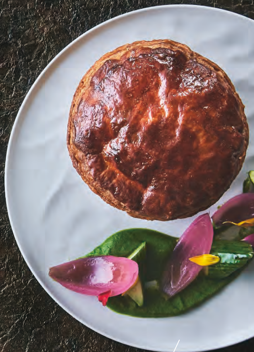
10時間煮込んだ ミートパイ