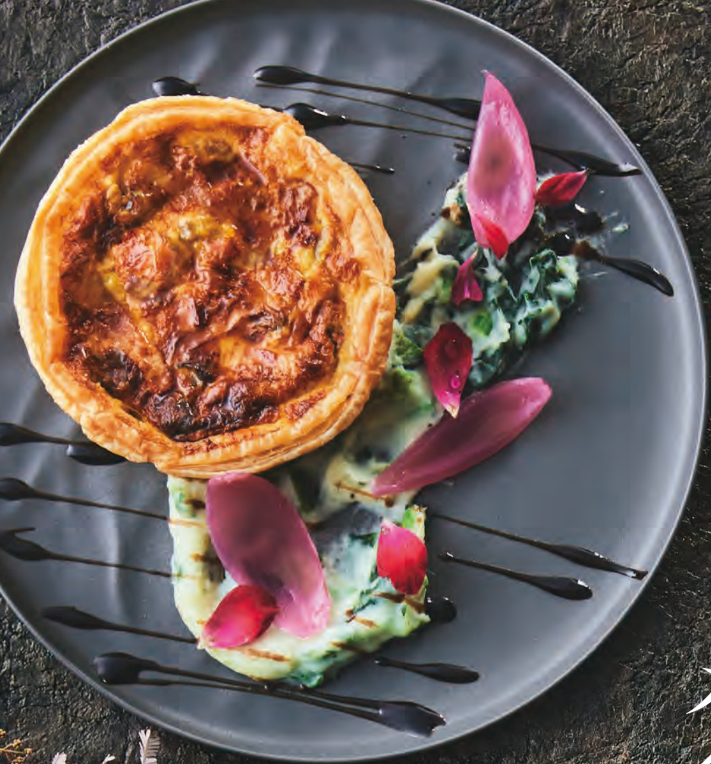
やさし平飼い卵の キッシュ