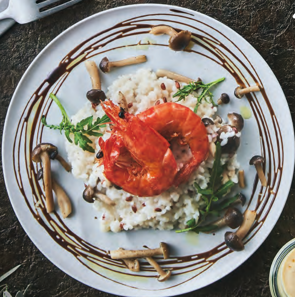
八郷古代米ときのこの リゾット/ ソフトシュリンプ