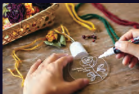
「光る！お絵かきオーナメントづくり」 丸いライトにお絵かきして作るオリ ジナルのオーナメント 参加費：600円