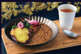
オリジナル欧風スパイスカレー