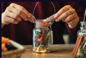
「光る！ボトルランタンづくり」 ドライフラワーや飾りを選んでつくる、 園内で持ち歩けるボトルランタン 参加費：1300円

園内の花や自然を使った多彩な「100の体感」アクティビティを開催。自分だけのひかるアイテムをつくって、イルミネーションを楽しもう！