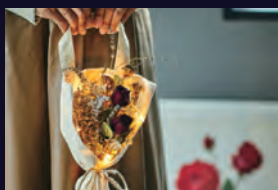
ひかるブーケバッグ 1500円

バッグとしても使えるひかるドライフ ワアーのブーケや、ひかる花飾りなど、身 に着けてもおしゃれで上品なひかる グッズが勢ぞろい。イルミネーションを 見に行く前にお立ち寄りください。