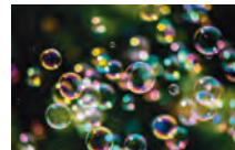
紅色しゃぼん (参加型企画)