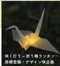
咲く灯り~折り鶴ランタン~ 商標登録・デザイン咲企画